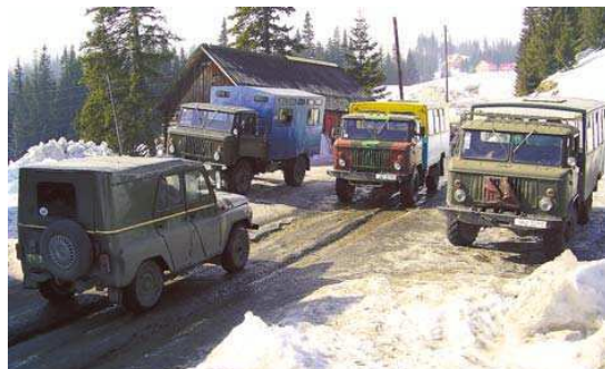
Doprava je veselé dobrodružná.