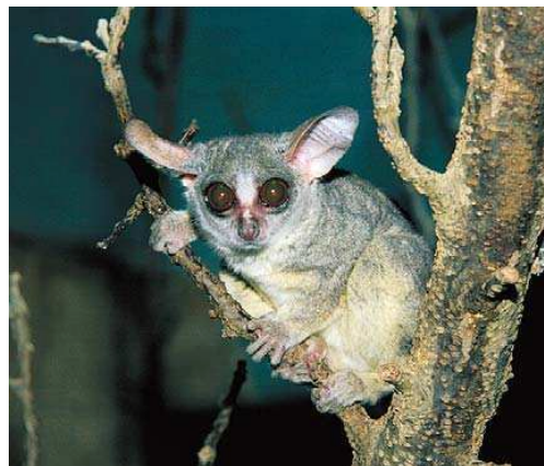
Komba ušatá je aktivní v noci.

Prohlídky se konají v pátek a v sobotu 14. a 15. 12., 21. a 22. 12. a o vánočních prázdninách (kromě 24. a 31. 12.). Je nutné se objednat telefonicky (296 112 230, 296 112 233) nebo e-mailem na pr@zoopraha.cz jav