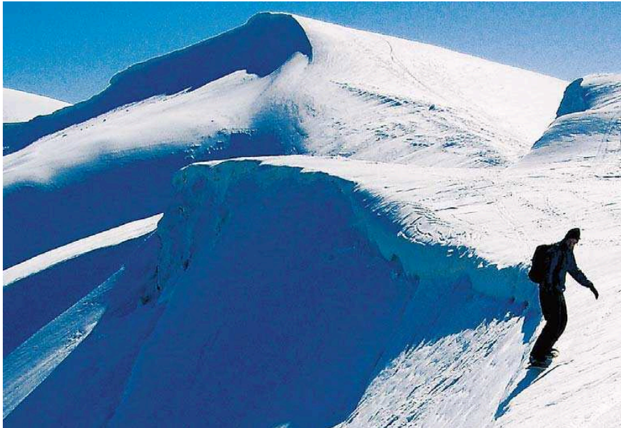
Volné terény tady mají kromě skvělých sněhových podmínek i další romantické rozměry.

Úroveň vleků na Dragobratu je srovnatelná s naší dvoukotvou. Většina sjezdovek je upravená. Bonusem střediska je možnost vybrat si urolbované tratě nebo volný terén, což uvítali především příznivci ježdění v hlubokém prašanu na neupravených svazích v blízkosti vleků.