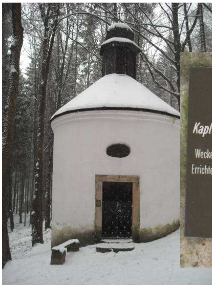
Panny Marie Sněžné z roku 1709